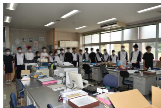
大会を終えた陸上部員が結果報告に職員室へ