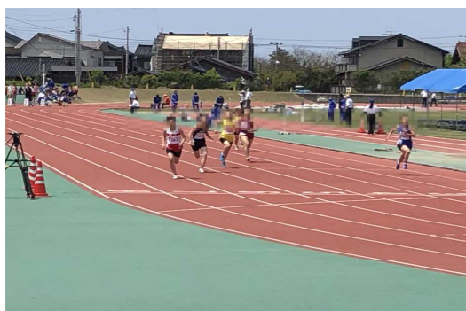
最後まであきらめない粘り強い走りでした

ちなみに、全校応援ができなかったため、学校に残った生徒は、午前は授業、午後は暑い中、環境整備作業に汗を流しました。