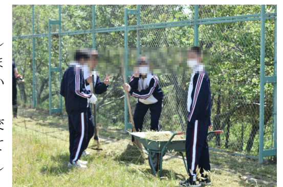
グラウンド除草の様子

部活動交流会では、今回は急遽、生徒と保護者の交流試合は中止になりましたが、練習する姿を見学していただきました。各部とも一生懸命に活動していました。