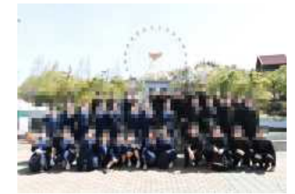
サントピアワールド