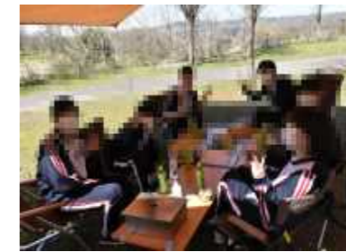
スノーピークミュージアム