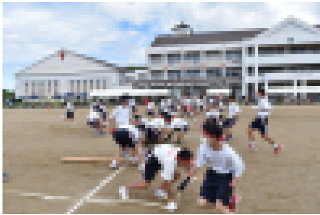
男の意地の見せどころ