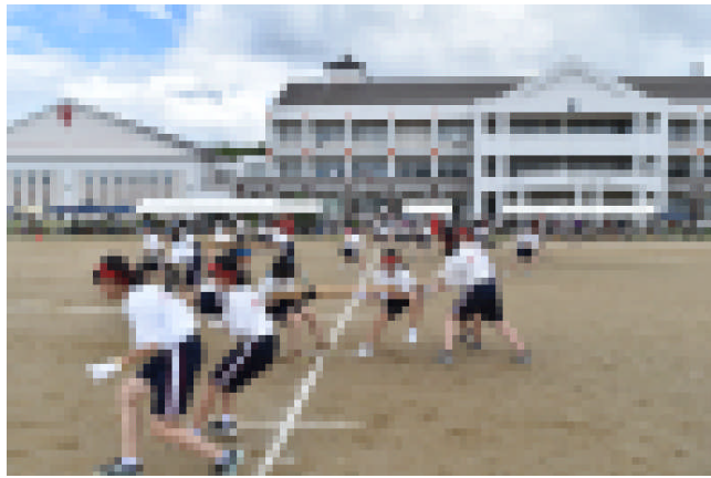
女の意地の見せどころ