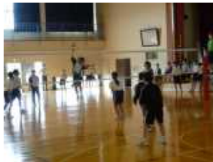
バレーボールの部

生徒会主催の球技大会が、7月13日(水)に行われました。種目は、バレーボールとドッジボールでした。結果は、バレーボールの部では職員チームが優勝し、ドッジボールの部では、2年生青チームが見事に優勝しました。体育館は暑かったですが、その暑さに負けないぐらい生徒たちは1つ1つのプレーに大いに盛り上がっていました。この大会を通して、各クラスの団結力がさらに高まったように感じます。生徒会の皆さん、全校の皆さん、先生方、本当にお疲れ様でした。