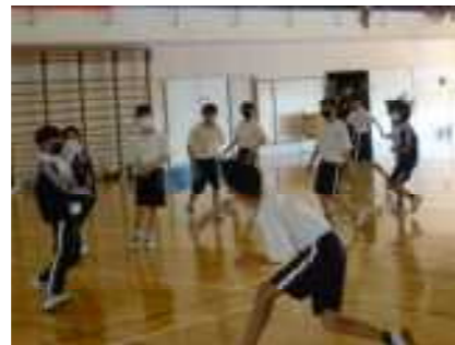
ドッジボールの部