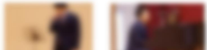
3学年部職員によるサプライズ