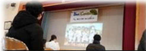
学年部によるスライドショー