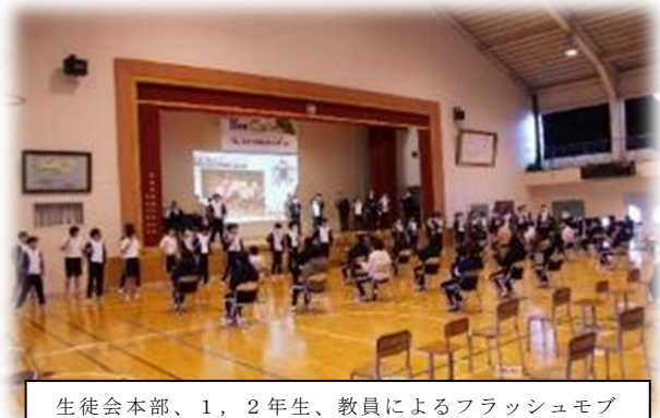
生徒会本部、1、2年生、教員によるフラッシュモブ