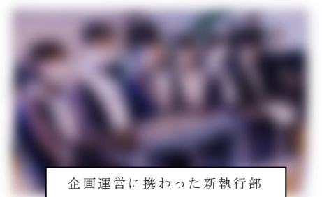
企画運営に携わった新執行部

そして、これだけでは終わらず、最後の最後に、サプライズ企画として『フラッシュ・モブ（複数人が突然ダンスなどのパフォーマンスを行うこと）』が行われました。曲はAKB48のフォーチュンクッキー。生徒会が踊り始め、教員も飛び入り参加し、最後に1、2年生全員で盛大に踊りました。体育館にいた全ての人が、楽しい気持ちになれたと思います。