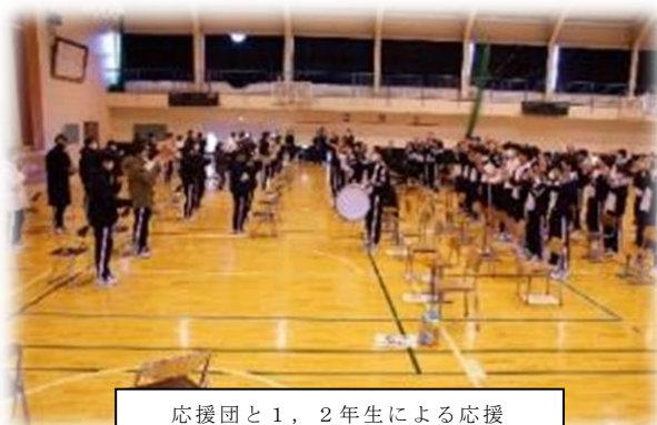
応援団と1、2年生による応援