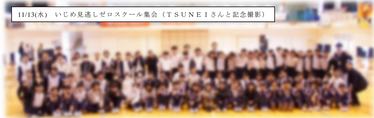
11/13(水) いじめ見逃しゼロスクール集会 (TSUNEIさんと記念撮影)