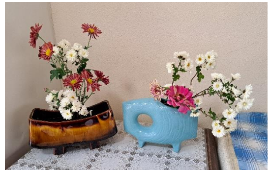
学校運営協議委員の方からいただいた菊

右の写真は、11月13日（水）オープンスクール当日、相川中学校の学校運営協議委員の方が、「校内にぜひ飾ってほしい」ということで、わざわざ持って来てくださった菊の花です。早速、生け花ができる職員が飾り付け、職員玄関等に設置しました。この件のように、相川中学校は地域の方や保護者の方から、大きく支えていただいています。深く感謝申し上げます。生徒たちも、大きく支えてもらっているという意識があるようです。それは7月に実施した学校評価から伺えます。地域に関するアンケートの結果は以下のようになりました。